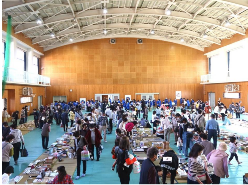
第38回庄内ふるさと祭り バザー 2023.11.4 庄内小体育館