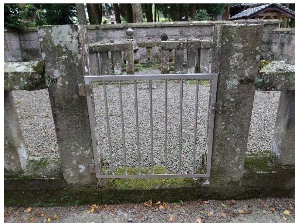
ステンレス製門扉取替後