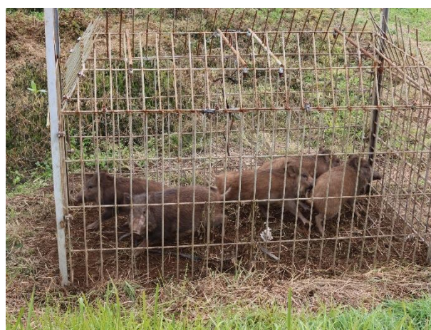
令和5年11月16日 イノシシ5頭捕獲 関之尾町