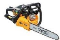
防災対策環境整備事業